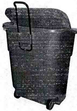
Ilustración 4 Carro de descanecado.