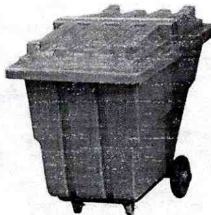
Ilustración 5 Carro de transporte de residuos.

Recipiente mínimo de 360 Litros limpio, sin fisuras, con tapa, ruedas en buen estado y rotulado de acuerdo al tipo de residuo. Cantidad 3: una roja, una blanca y una negra. (ver ilustración 5).