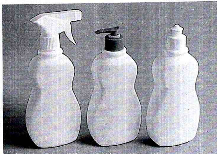
Ilustración 2 Contenedores de PVC spray, para productos de aseo.