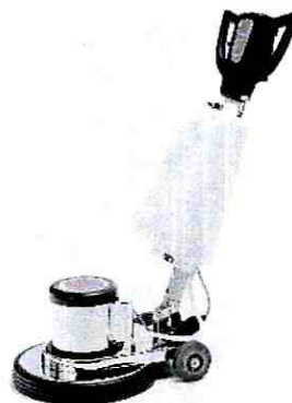
Ilustración 3 Brilladora industrial.

Brilladora de 17 pulgadas material en Aluminio, motor 110v, 75 RPM, 1100W. Cantidad 2. (Ver ilustración 3)