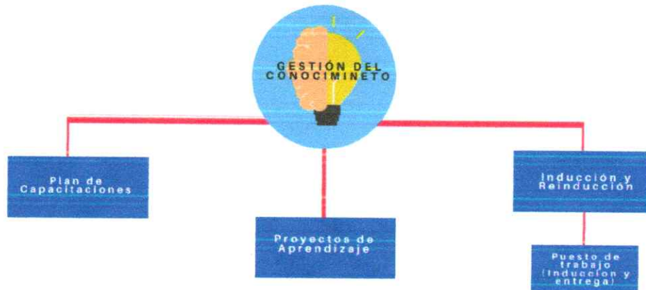
Grafico 1: componentes del Plan de Gestión de Conocimiento.

USO DE LA ESE HOSPITAL REGIONAL DE CHIQUINQUIRÁ